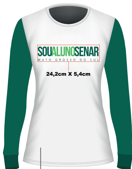
F R E N T E