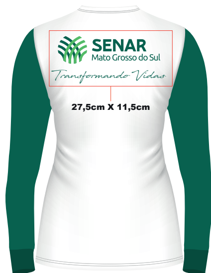
C O S T A